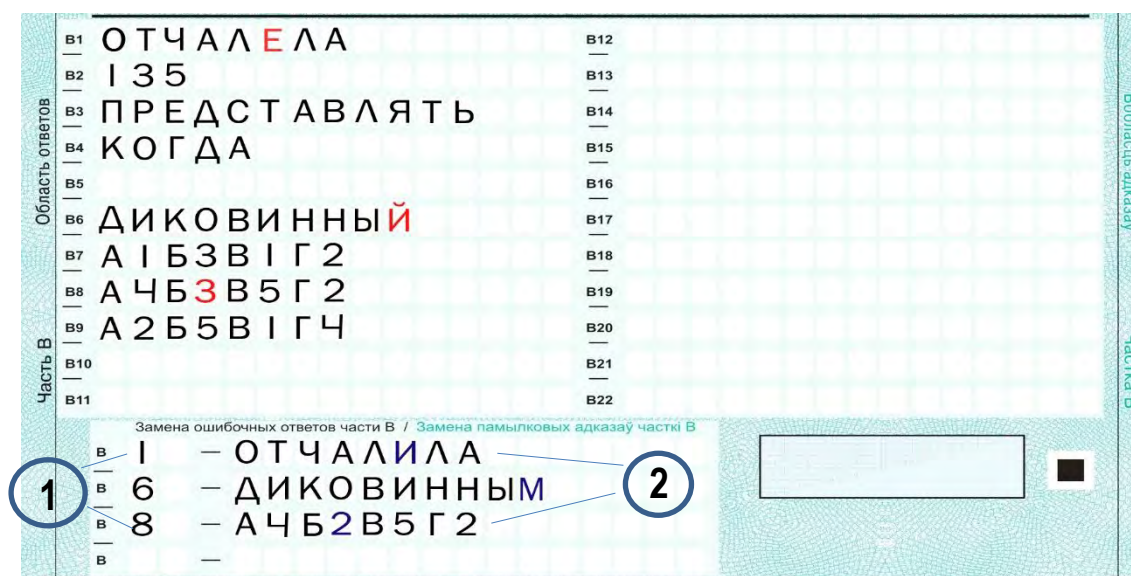
Рис. 4. Область замены ошибочных меток в части В

При проведении централизованного экзамена по иностранным языкам ответственный педагогический работник обязан сообщить участникам ЦЭ, что образцы написания латинских букв находятся в самой экзаменационной работе перед частью В.